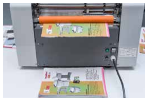
Auslage mit Einzelblattablage

Besuchen Sie uns in unserem Showroom für eine unverbindliche Vorführung. Wir freuen uns auf Sie.