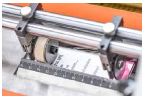
Mikroperforation der Bogen