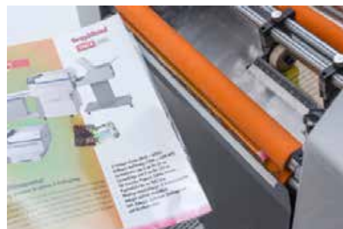
Automatischer Trennvorgang der Bogen