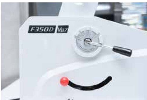
Einfach Druck der Heizwalzen einstellen