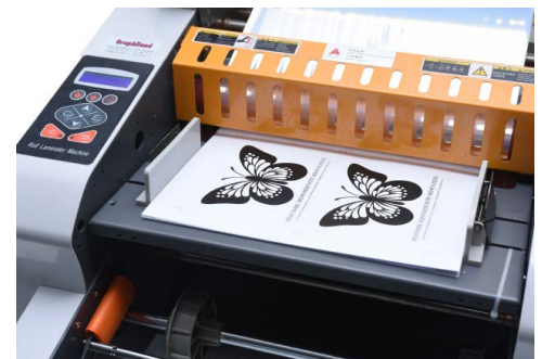
Anleger mit grossen Seitenführungen

Besuchen Sie uns in unserem Showroom für eine unverbindliche Vorführung. Wir freuen uns auf Sie.