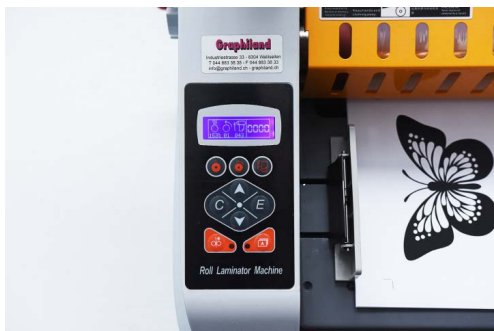
Volle Kontrolle über den LCD-Display